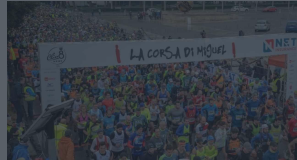
La corsa di Miguel, una delle maratone più seguite di Roma

Torna una delle maratone più belle eseguite della capitale. Il Club Atletico Centrale organizza per Lunedì 25 Aprile 2022 a Roma la 22ª edizione della Corsa di Miguel gara su strada sulla distanza di 10,100km. Il ritrovo è previsto dalle ore 7:00 allo Stadio dei Marmi, la partenza alle ore 9:00 da Lungotevere Maresciallo Diaz. L'organizzazione si riserva di poter modificare gli orari del raduno e delle partenze dandone tempestiva comunicazione a tutti i partecipanti. Il traguardo sarà collocato come sempre sulla pista dello Stadio Olimpico*